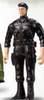
Imagem meramente ilustrativa. O rosto e os braços dos soldados não são pintados.